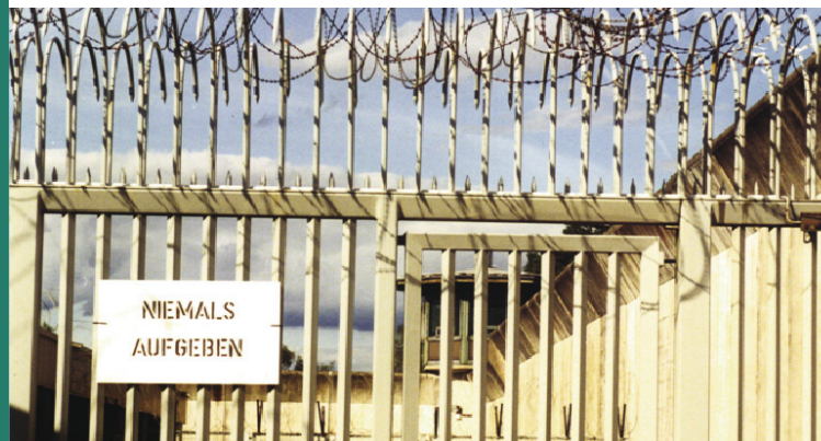
Aufnahme anlässlich einer Theateraufführung von Gefangenen in der JVA Salinenmoor